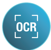
Reconhecimento óptico de caracteres

Ciclos de trabalho mais altos e intervalos de manutenção periódica fornecem maior volume com menos chamadas de serviço de rotina para que você possa manter o foco na produtividade.