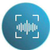
Orientação por voz